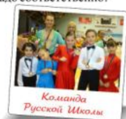
Команда Русской Школы

В Турции стартует международный проект "500 маленьких скрипачей". Цель проекта - научить детей от 3 до 12 лет, никогда не игравших на скрипке, исполнять определенную музыкальную композицию в составе оркестра. Этот проект уже был успешно реализован в Германии и Японии. Обучение начинается в небольших группах и постепенно ведется объединение групп в оркестр. Итогом проекта станут выступления детского оркестра скрипачей на площадке Анталии с 22 по 27 апреля 2010 года, приуроченные к Дню ребенка в Турции. Надеемся, что этот проект заинтересует учеников нашей школы, и, возможно, кто-то полюбит скрипку на всю жизнь.