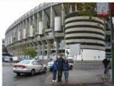
△ Стадион Сантьяго Бернабеу Мадрид, Испания