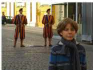
△ Охранники Ватикана вам никого не напоминают?