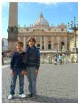
△ Площадь Святого Петра, Ватикан, Рим Италия