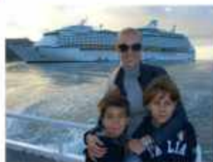
△ Наш корабль