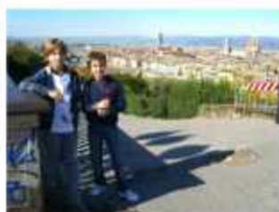
△ Флоренция у наших ног, Италия