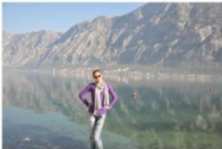
Я увидела свое отражение в озерах Черногории...