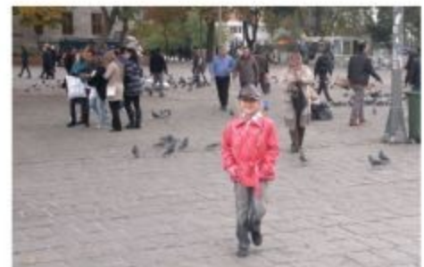
... кормила голубей на стыке Европы и Азии...