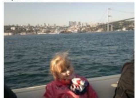
Я переплыла Босфор...