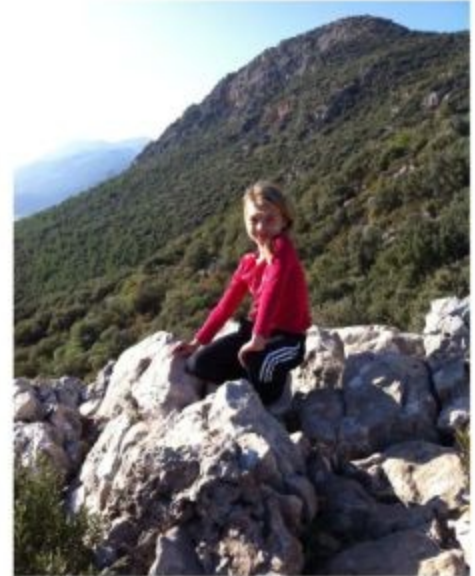
... покорила одну из горных вершин Турции