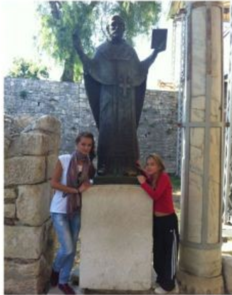
... посетила церковь Святого Николая в Демре...