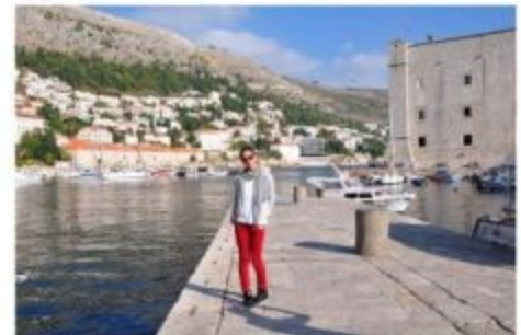
... прогулялась на яхте вдоль берегов Хорватии...