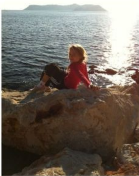
Я любовалась морем в Каше...