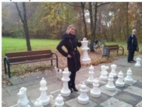
Я выиграла шахматную партию в Южной Баварии...