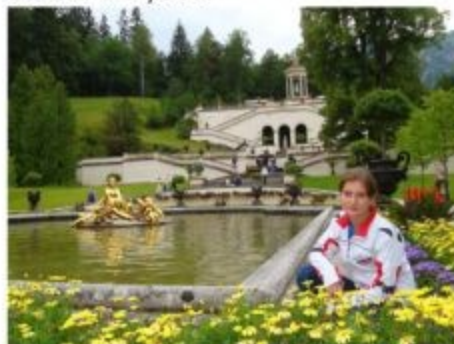
... побывала в замках Людовига II...