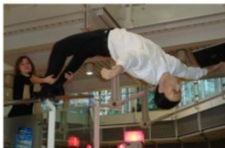
... спасла человека в аэропорту Мюнхена...