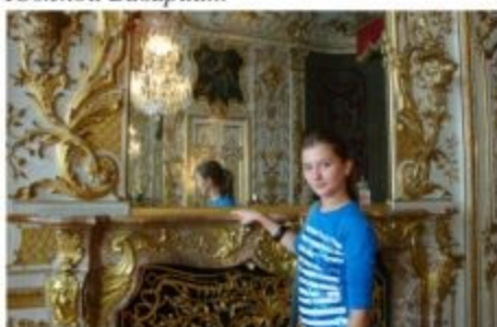
... была на приеме в королевских покоях ...