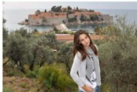
... познакомилась с маленьким городком Святой Стефан ...